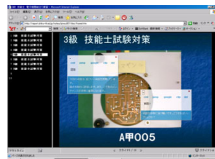
図2 試験対策活用例