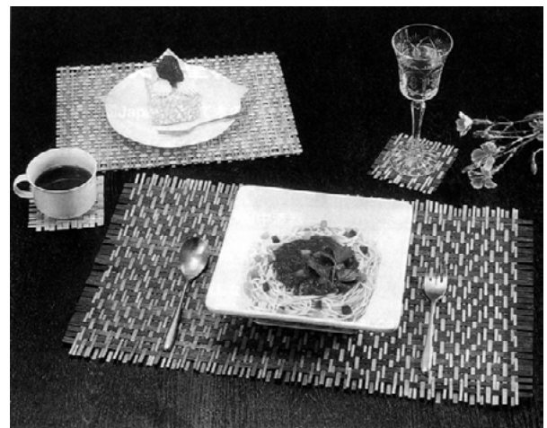
着色及び編み目を活かしたランチョンマット、コースター