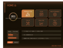
図2 改良前のUI(上) 改良後のUI(下)