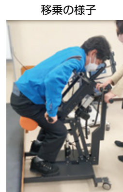
図 開発した移乗機器